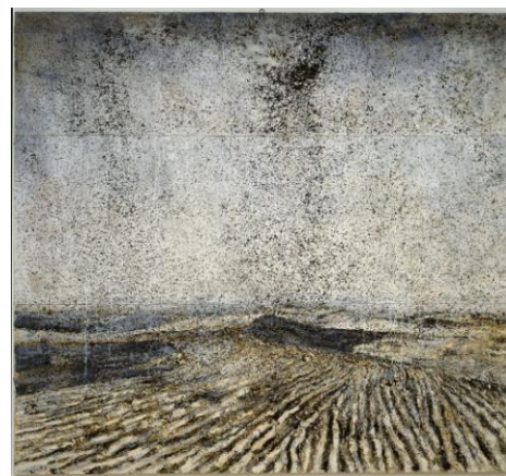
Die Sechste Posaune (The Sixth Trumpet), 1996 - émulsion, acrylique, laque et graines de tournesol sur toile, 520 x 560 cm