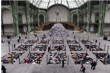
Personnes , Monumenta 2010

Boltanski questionne la frontière entre absence et présence. En effet, l'absence est un sujet récurrent dans son travail : la vidéo comme la photo sont des présences, des mémoires qui, selon lui, au lieu de faire revivre les absents vont au contraire mettre davantage en évidence leur disparition. Il emploie de multiples matériaux (photographies anciennes, objets trouvés, carton ondulé, pâte à modeler, luminaires, bougies...)