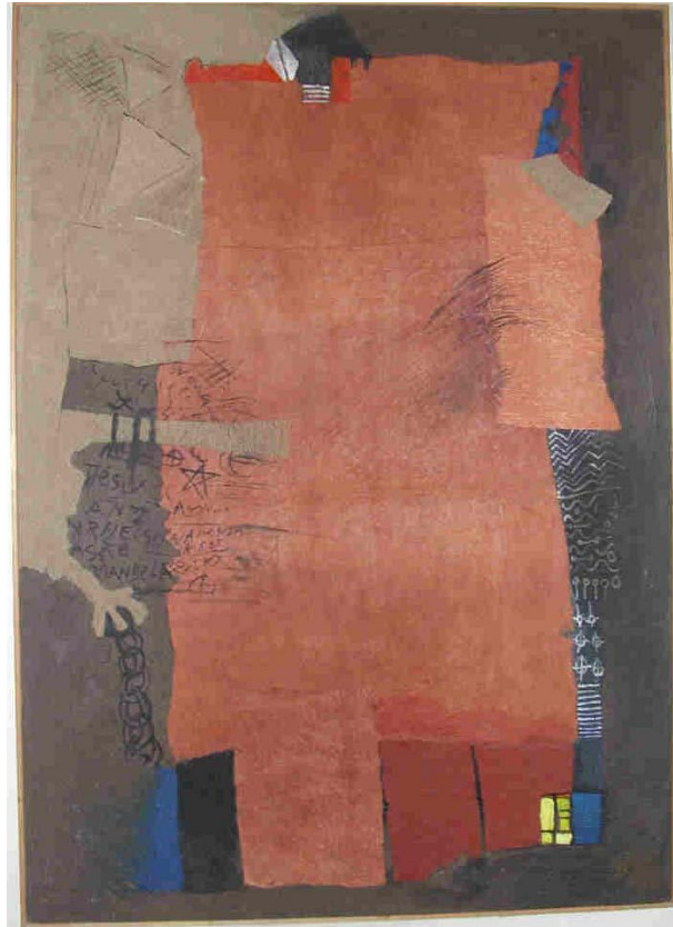
Mandela, 1993 N'GUESSAN, Kra Matériaux divers Hauteur : 125 cm Largeur : 100 cm