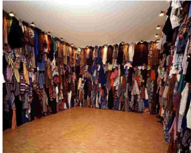
Réserve , 1990 Installation Tissu, lampes. Dimensions variables