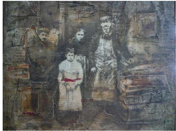
Huile et matériaux divers sur toile H 82.5 x L 101 cm

http://www.alain-kleinmann.fr/accueil2.html