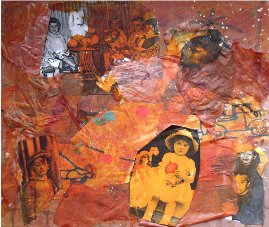
Une production réalisée dans une classe de moyenne section en 1992

Organiser, mettre en scène ou en espace, installer.