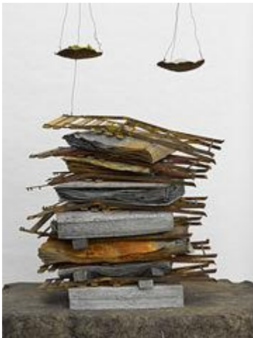
Nigredo (détail), 1998 – Plomb, acier, fil métallique, huile, sel, plâtre, résine, acrylique et pastel, 320 x 160 x 100 cm

Les toiles et, plus généralement, les œuvres d'Anselm Kiefer, saturées de matière (sable, terre, feuilles de plomb que Kiefer appelle « Livres », suie, salive, craie, cheveux, cendre, matériaux de ruine et de rebut), évoquent la catastrophe et les destructions de la Seconde Guerre mondiale, en particulier la Shoah. Le choix des matières exprime également sa sensibilité à la couleur : « Plus vous restez devant mes tableaux, plus vous découvrez les couleurs. Au premier coup d'œil, on a l'impression que mes tableaux sont gris mais en faisant plus attention, on remarque que je travaille avec la matière qui apporte la couleur. »